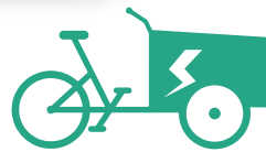
VÉLO CARGO (À ASSISTANCE ÉLECTRIQUE)

NEUF : Jusqu'à 300€ OCCASION : Jusqu'à 150€