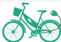
VÉLO À ASSISTANCE ÉLECTRIQUE (HORS VTT, COURSE ET BMX)

NEUF : Jusqu'à 150€ OCCASION : Jusqu'à 100€