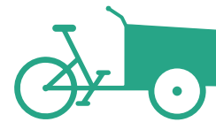
VÉLO CARGO CLASSIQUE

NEUF : Jusqu'à 400€ OCCASION : Jusqu'à 200€